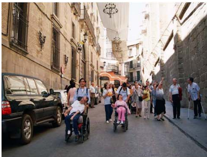
Visita cultural (Toledo)