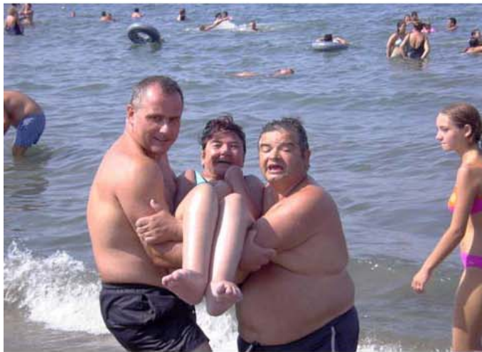
Colonia de verano