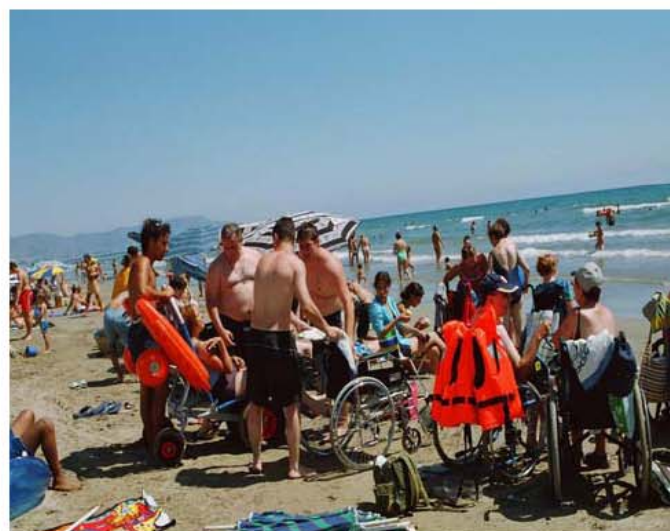
Colonia de verano