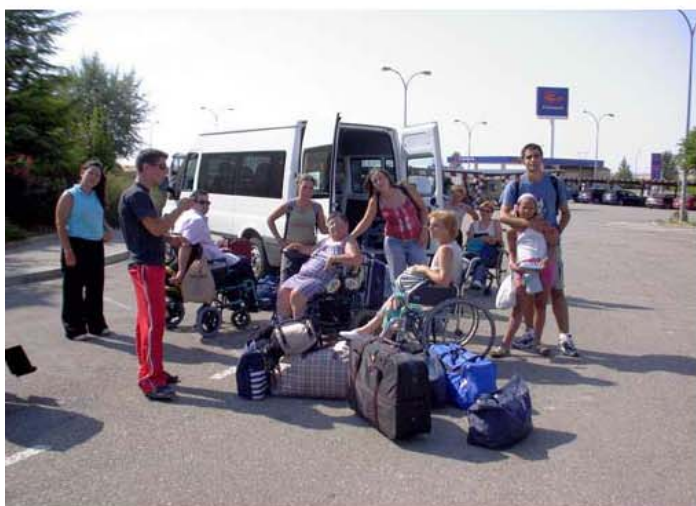
Colonia de verano