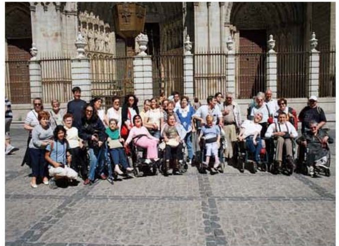
Visita cultural (Toledo)