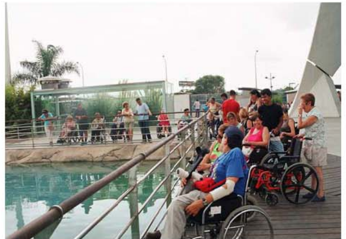
Colonia de verano