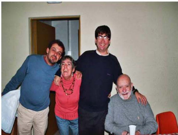
Encuentros de amistad