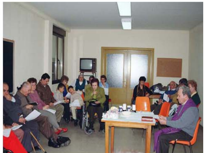
Celebración de la Navidad